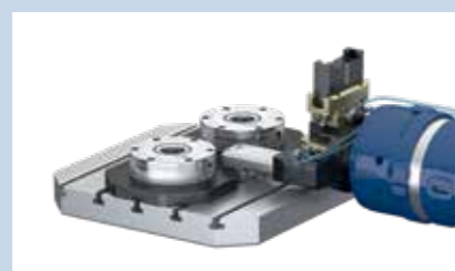
2 Apertura della piastra di serraggio tramite modulo cambio pallet.