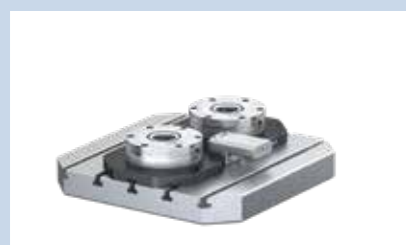
1 VERO-S NSL3 200 con passaggio fluidi.