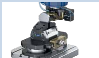
5 Carico automatizzato del pezzo.