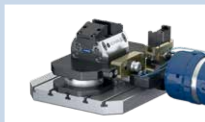
4 Il robot si aziona. La piastra di serraggio si blocca.