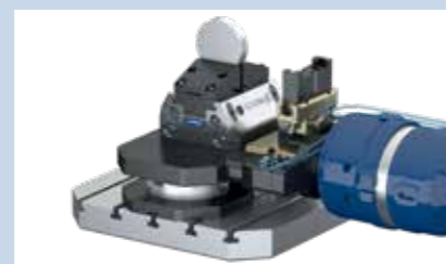
6 Il robot blocca il dispositivo di serraggio.