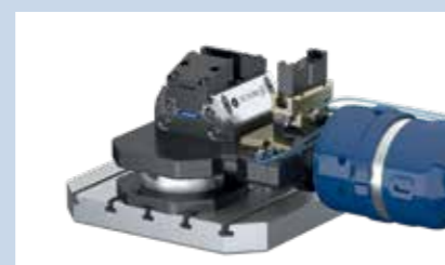
3 Posizionamento del pallet di serraggio. Apertura del dispositivo di serraggio.